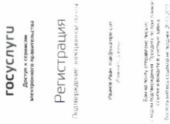
Рисунок 4. Страница подтверждения адреса электронной почты

Если выбран способ регистрации по электронной почте, то отобразится страница подтверждения адреса электронной почты пользователя (рис. 4).