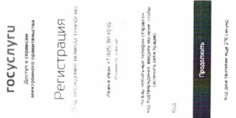
Рисунок 3. Сообщение о необходимости подтверждения номера мобильного телефона

Если выбран способ регистрации по мобильному телефону, то будет отправлено sms-сообщение с кодом подтверждения номера мобильного телефона 1 . Его необходимо ввести в специальное поле, которое отображается на экране (рис. 3). Данный код можно ввести в течение 5 минут (данная информация отображается в виде обратного отсчета секунд), если время истекло, то можно запросить новый код подтверждения номера мобильного телефона.